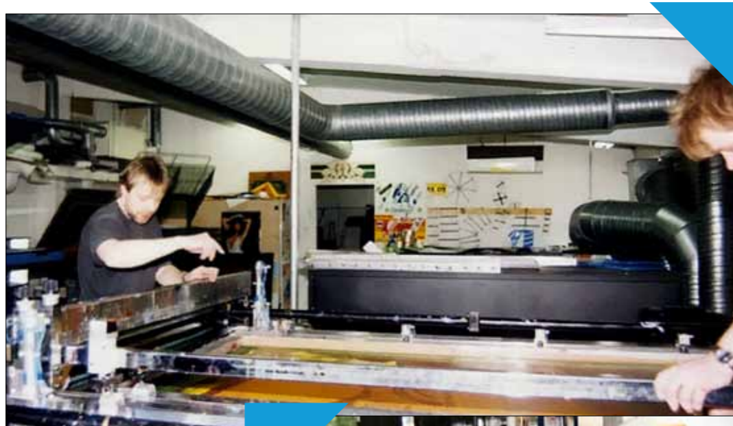
Kahdella miehellä väri kerrallaan, pientä säätöä ei voinut painamisen aikana välttää mitenkään. Seula muuten pestiin aina tinnerillä.

Kaksi väriä painettu (yellow ja magenta), seuraavaksi cyan ja lopuksi musta. Sen jälkeen käsin muotoonleikkaus ja teippaus autoon. Purkkien määrästä voi päätellä kuinka paljon eri sävyjä oli käytettävissä.